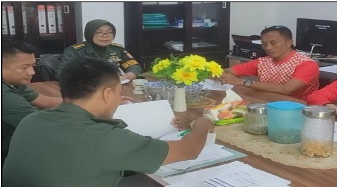
KEGIATAN AUDIT MUTU INTERNAL