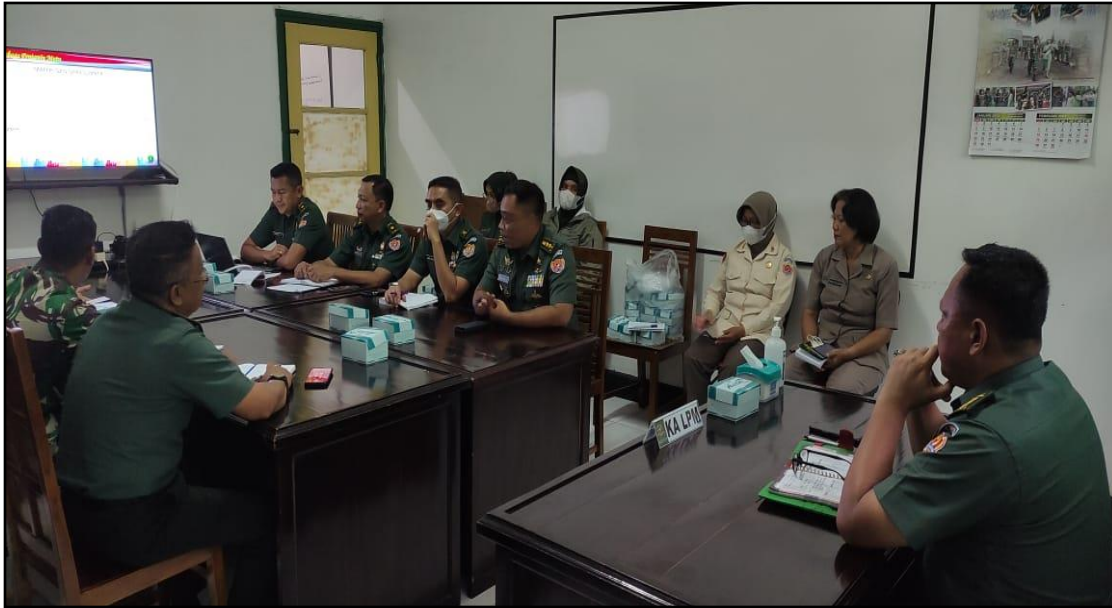
KEGIATAN ENTRY BRIEFING