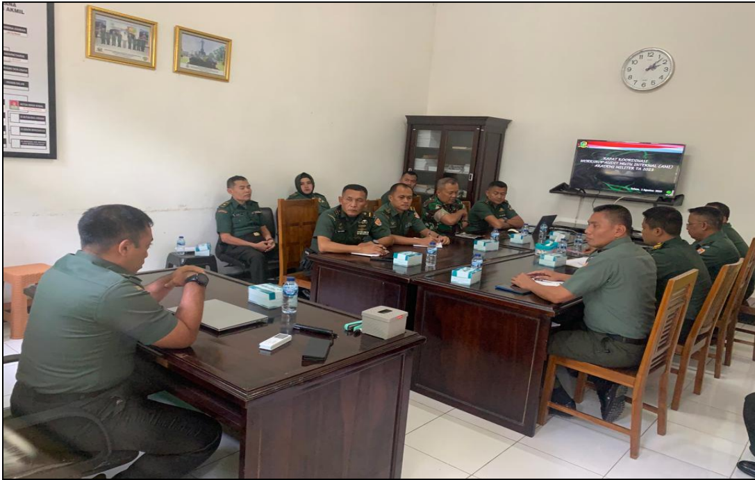
KEGIATAN EXIT MEETING